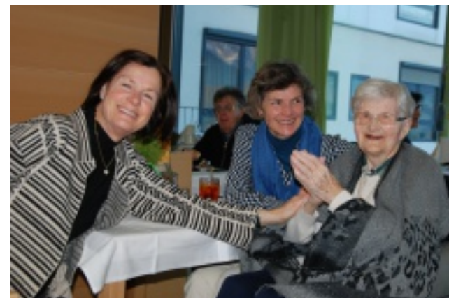
Ein gemütlicher Weihnachtsnachmittag für Bewohner und deren Angehörige