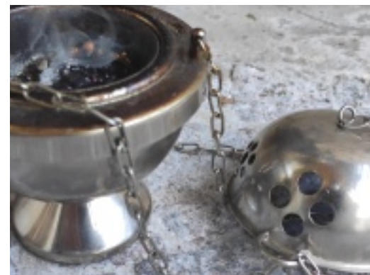
"Kini-Raachn" und Segnung