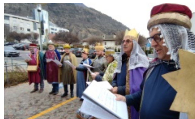
Der Besuch der Starnsinger