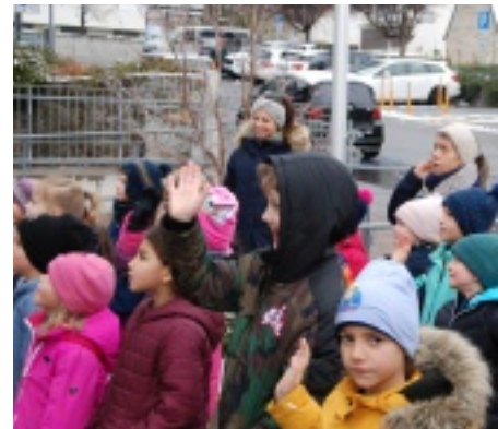
Die Schlanderser Grundschüler singen Advents- und Weihnachtslieder