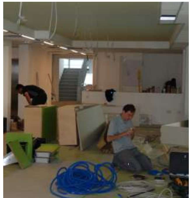
Handwerkerarbeiten vor dem Umzug