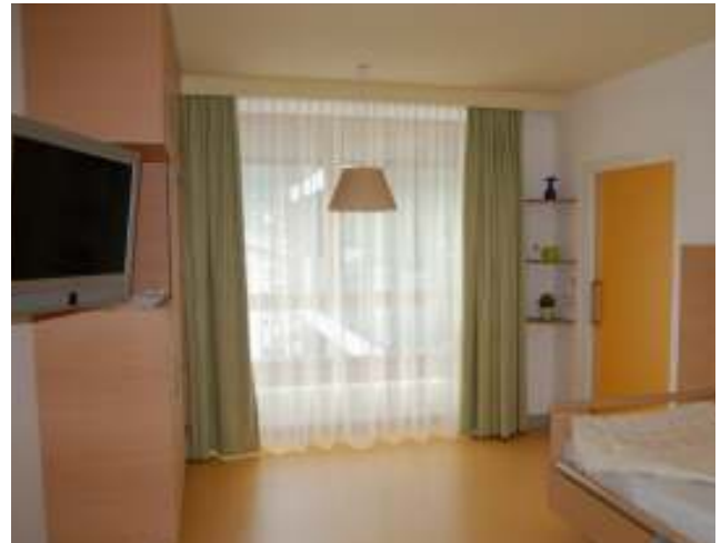
Ein neues Bewohnerzimmer vor dem Einzug