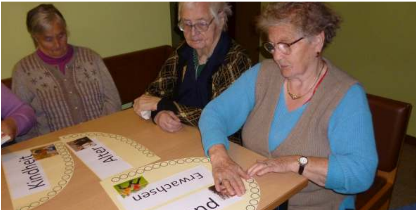
Die "Lebensreise" fördert die Kommunikation und das Gedächtnis der Teilnehmer