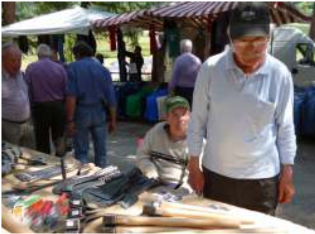
St. Veithsmarkt in Tartsch