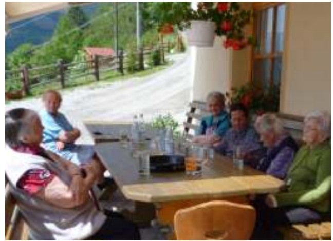
Ausflug Birkenhof Schluderns