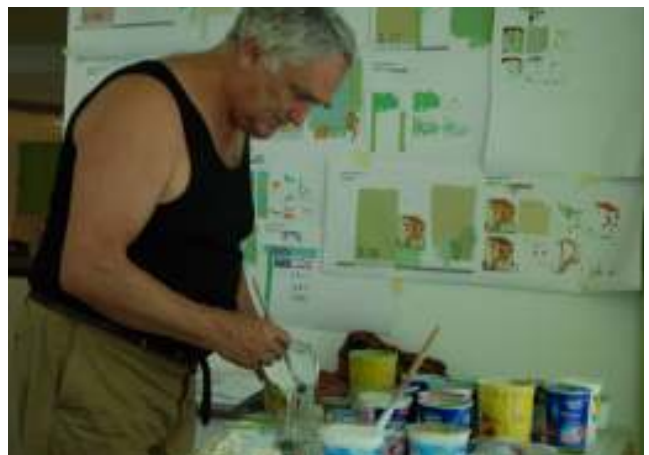
Künstlerische Gestaltung eines Wohnbereichs