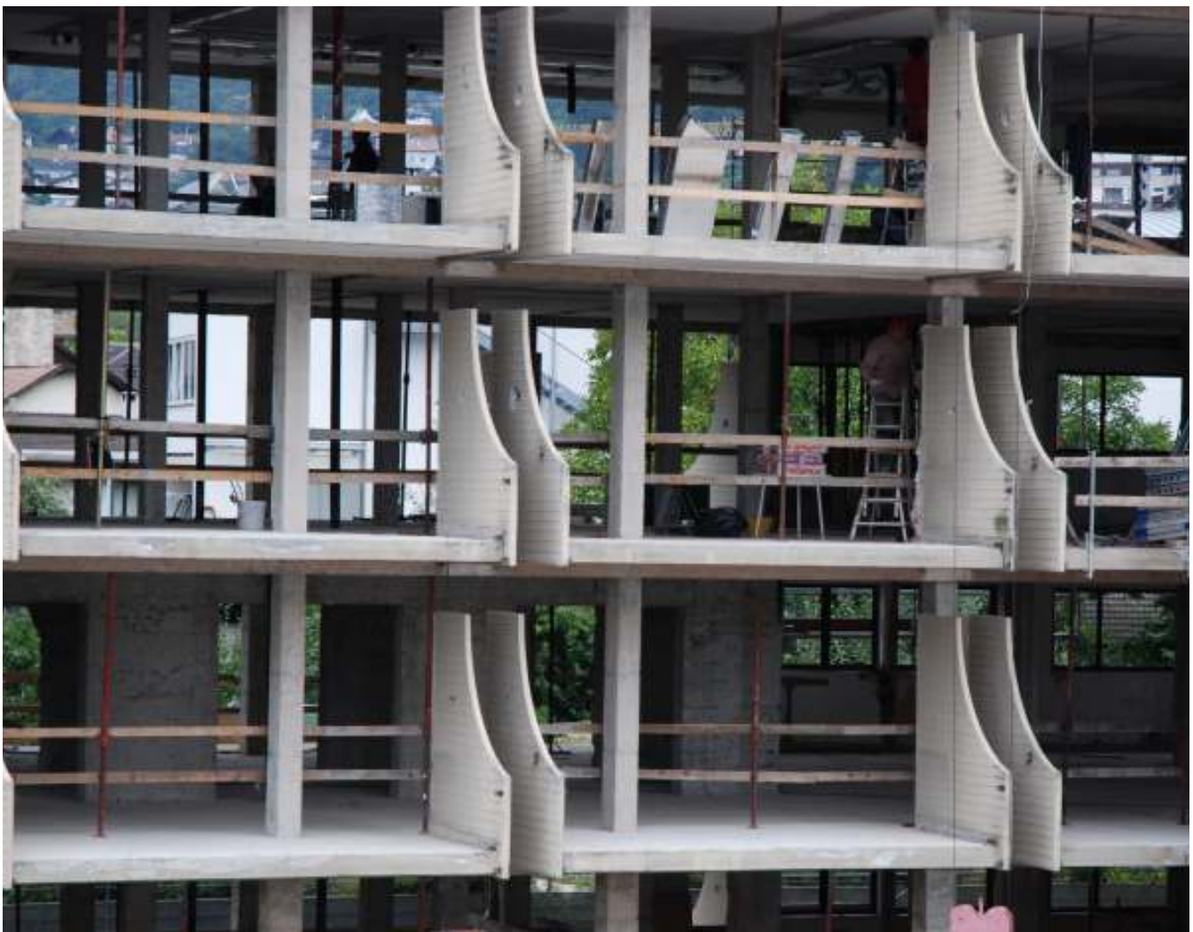
Ein Teil des ausgehöhlten A- Traktes des Bürgerheimes