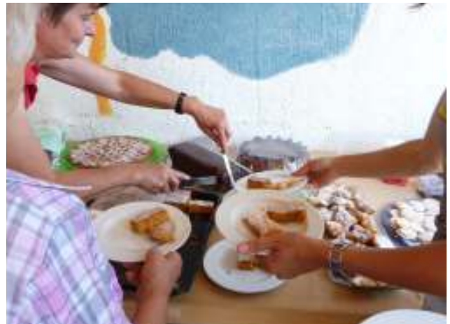
Kaffee und Kuchen im Garten