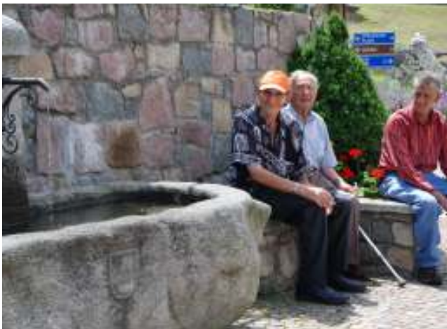
Ausflug ins Passeiertal