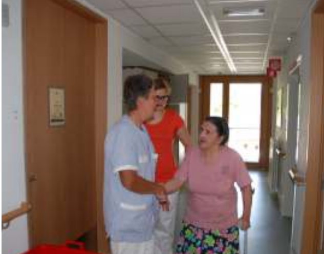
Die Bewohner werden im neu errichteten B-Trakt Willkommen geheißen