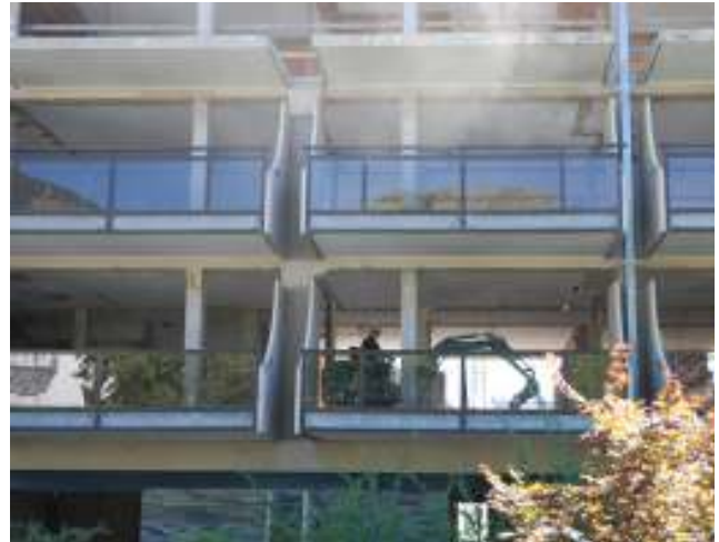
Abbrucharbeiten im A-Trakt