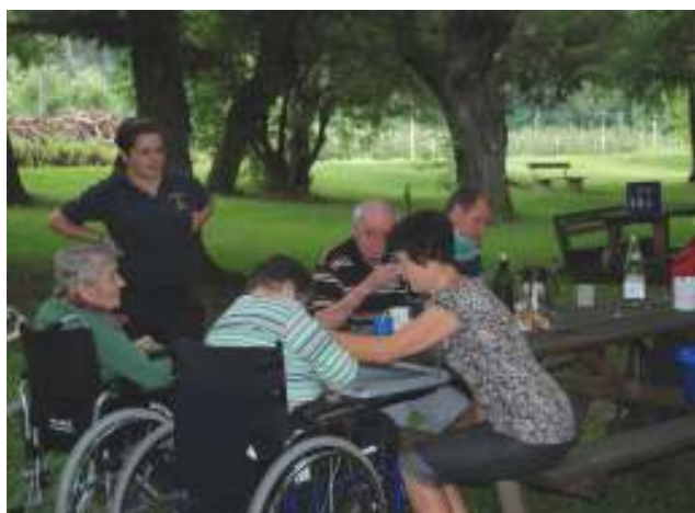
Ausflug Park Latsch