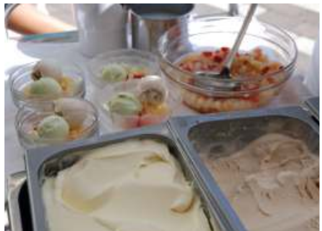
Eisessen im Garten