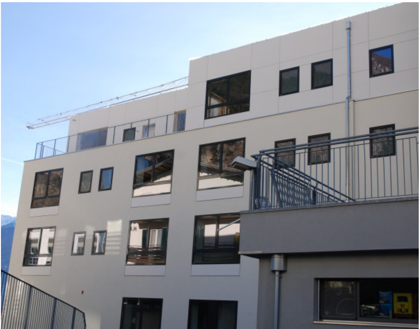
Schön langsam kann man sehen, wie das Bürgerheim einmal aussehen wird