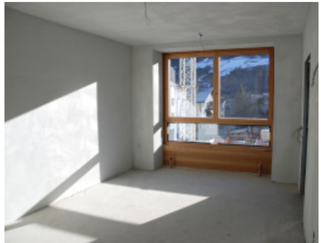
Die Verputzarbeiten sind abgeschlossen