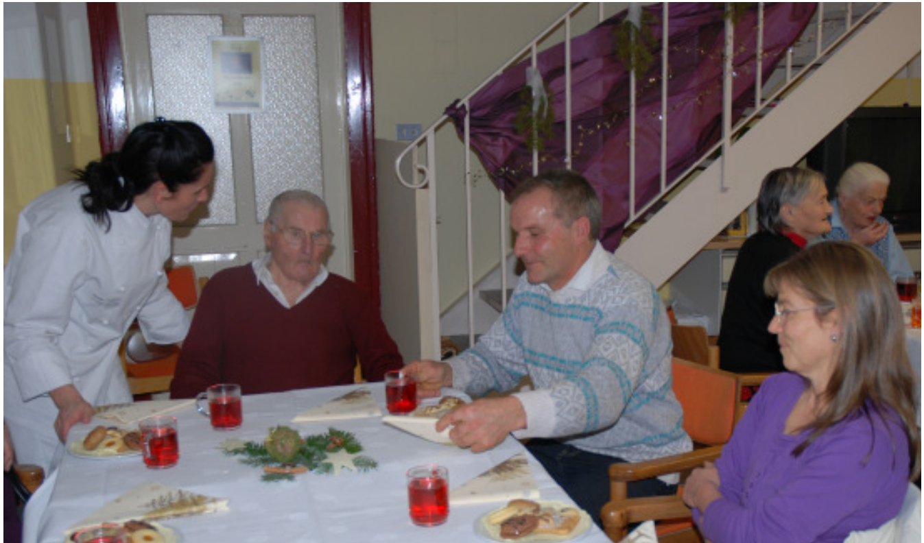
Weihnachtsfeier in der Außenstelle Mals