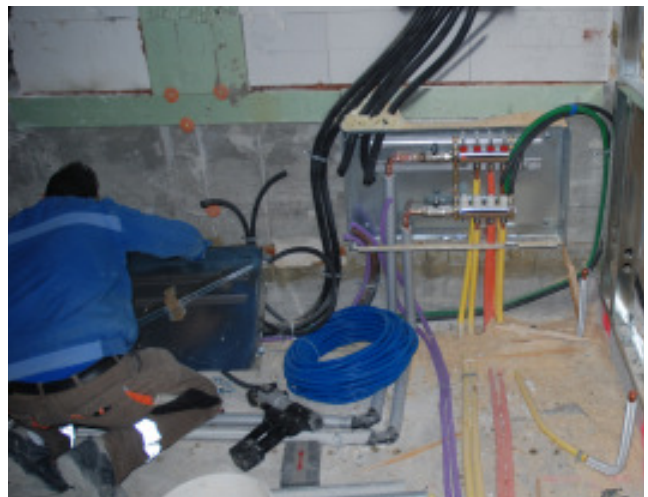
Fortführung der Elektro- und Sanitärarbeiten