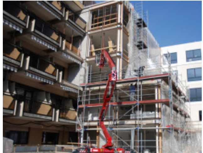
Montage des Gerüstes für die Glasfassade