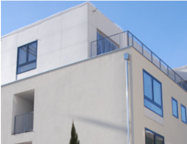
Fertigstellung der Terasse im 4. Obergeschoss