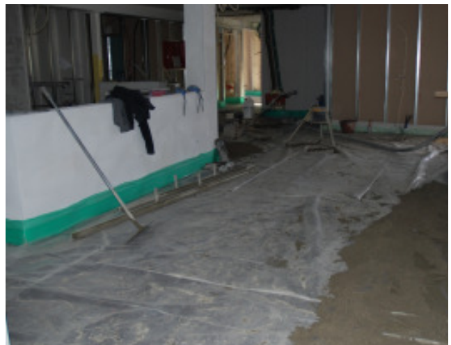
Unterböden im 4. Obergeschoss