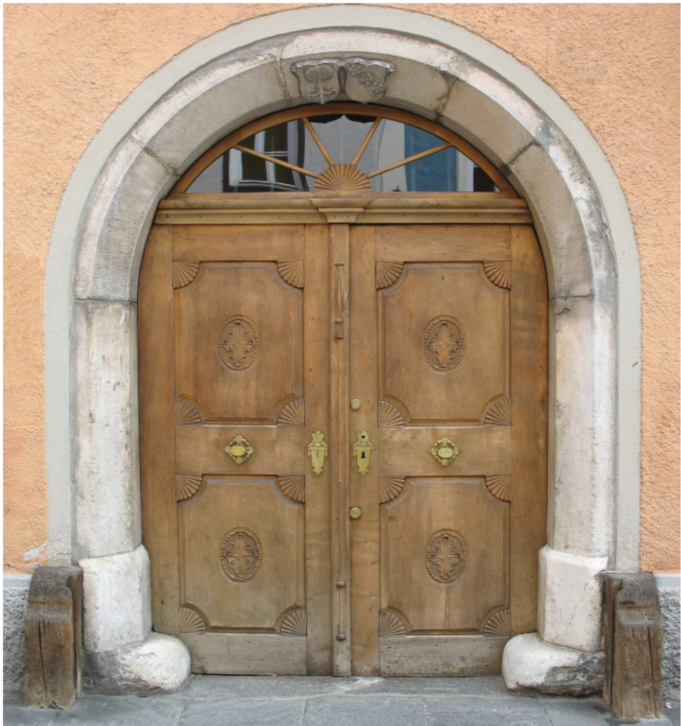
Eingangstor in Sterzing

Ausgabe Oktober, November, Dezember, Januar 2012 - Erscheinungsdatum: 01. März 2012 - Nr. 4