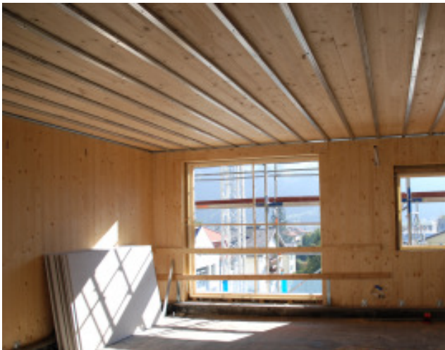
Leichtbauweise im 4. Obergeschoss