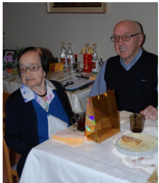
Weihnachtsfeier im Bürgerheim Schlanders