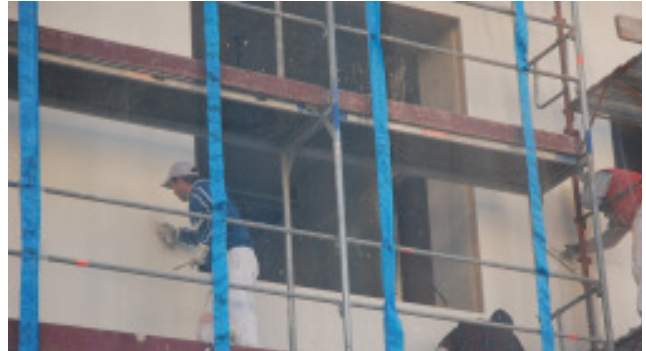
Fertigstellen der Außenfassade

In den Monaten von Oktober 2011 bis Jänner 2012 sind einige Arbeiten so weit fortgeschritten, dass die Schlander- ser Bürgerinnen und Bürger nach und nach einen Eindruck erhalten, wie das Bürgerheim einmal aussehen wird, wenn alle Arbeiten abgeschlossen sind. Die nachfolgenden Fotos und Erklärungen sollen dies verdeutlichen.