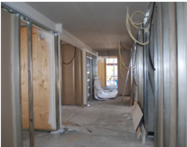
Trennwände im 4. Obergeschoss