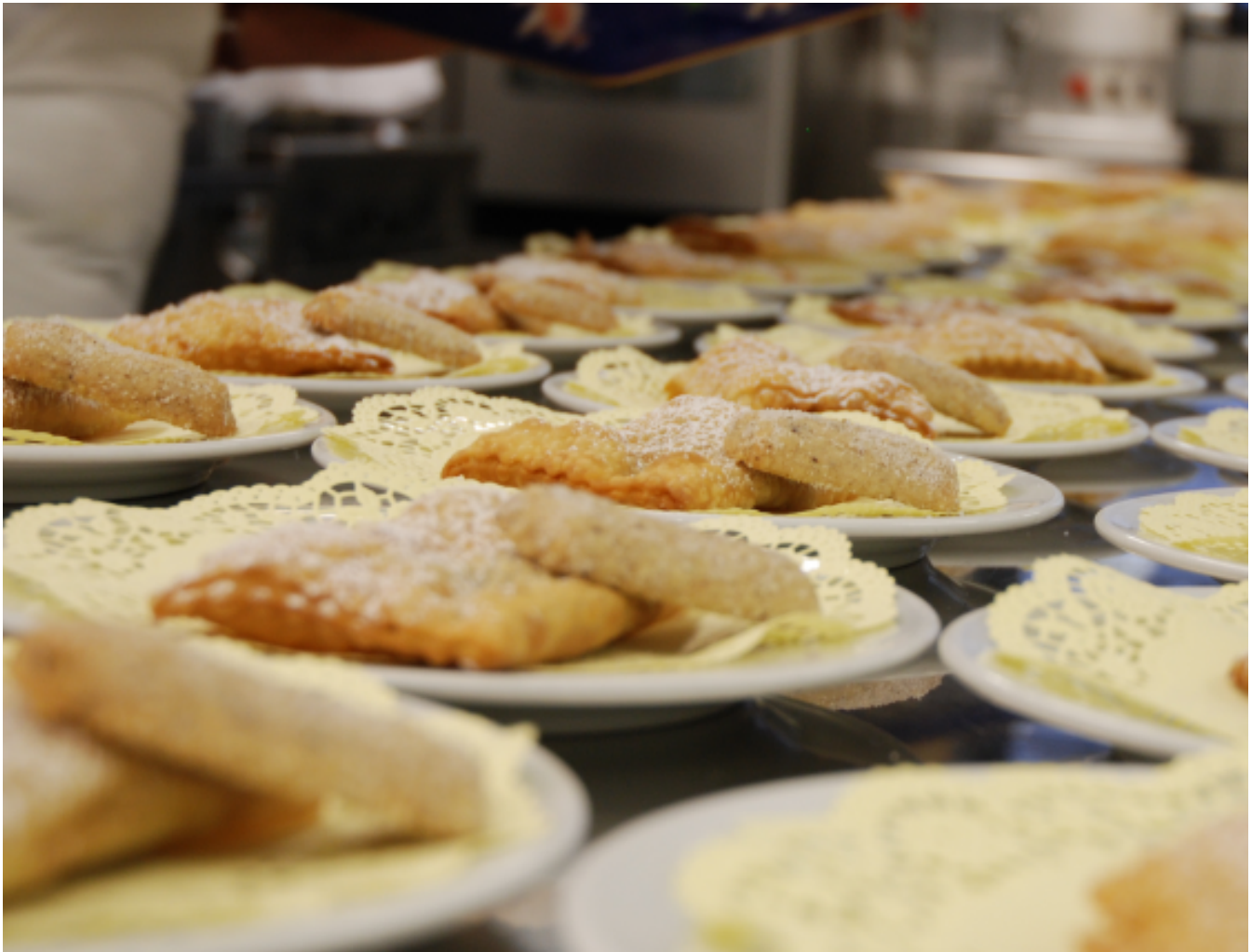
Großer Wert wird im Bürgerheim auf das Zubereiten von traditioneller Kost gelegt