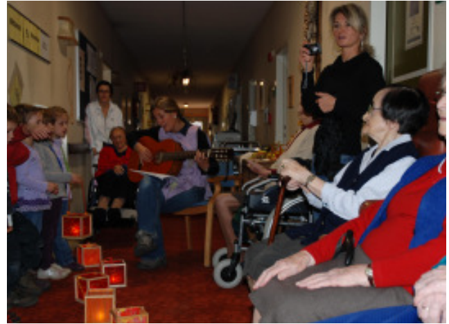
Kindergartenkinder besuchen zu "Martini" die Bewohner des Bürgerheims