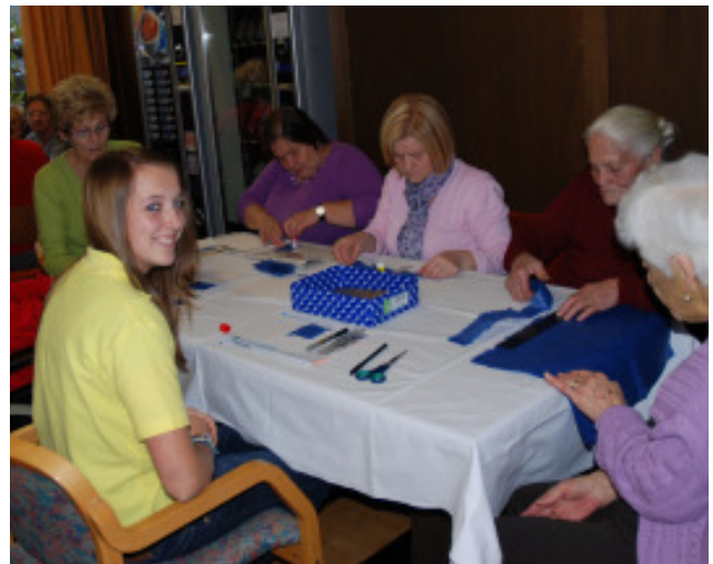
Anfertigen von Weihnachtskarten