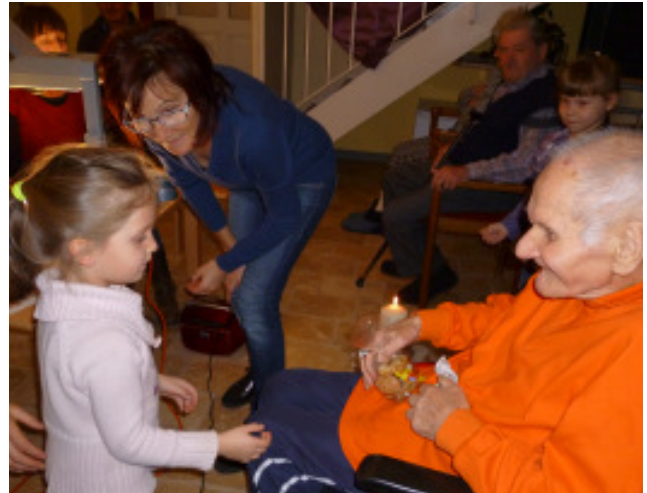
Schattenspiel aufgeführt von den Kindern des Kindergartens Laatsch