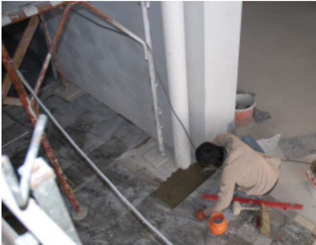
Verlegung des Steinbodens