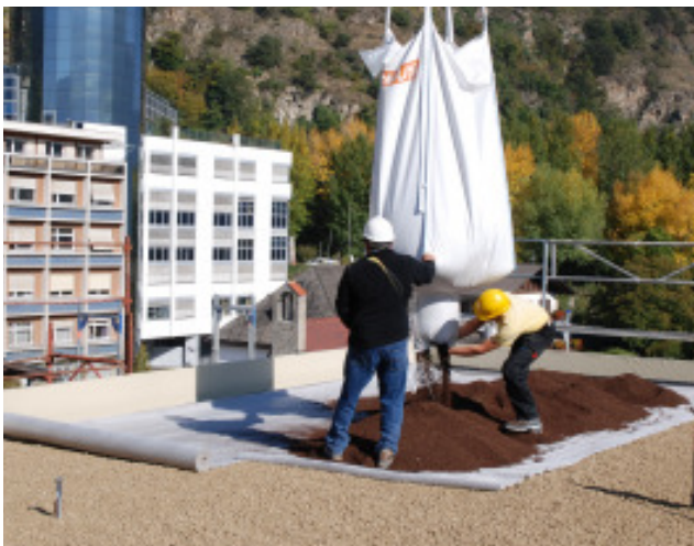
Fertigstellung des Flachdaches des B-Traktes