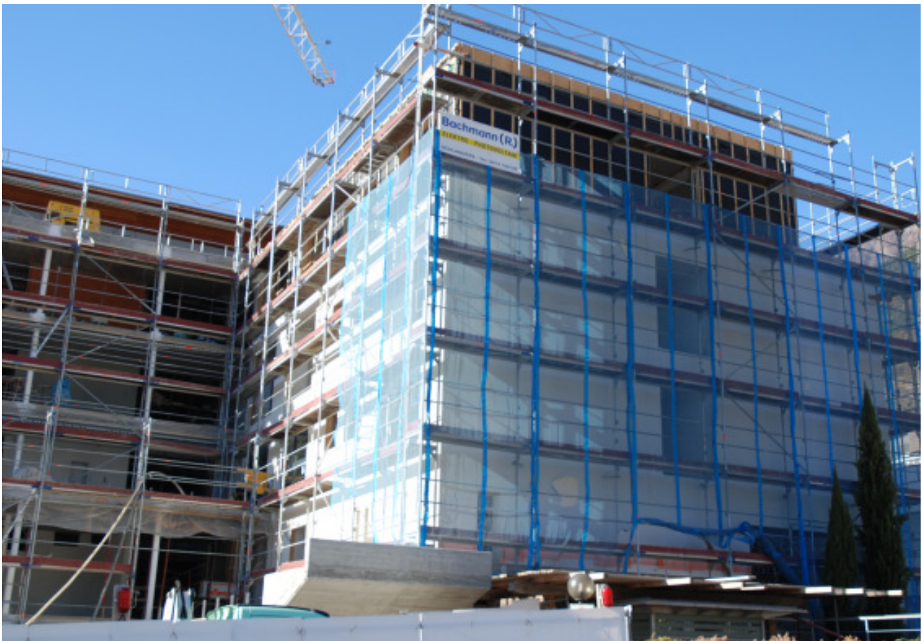
Noch vor Weihnachten fehlen sämtliche Fenster ...