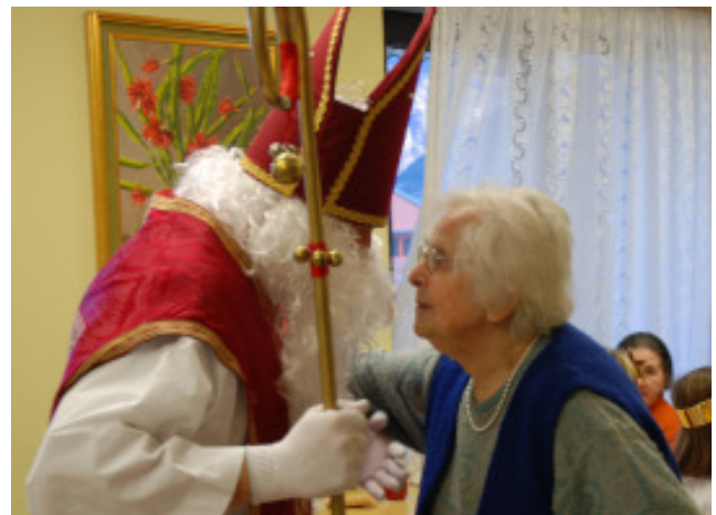
Nikolausfeier im Bürgerheim Schlanders