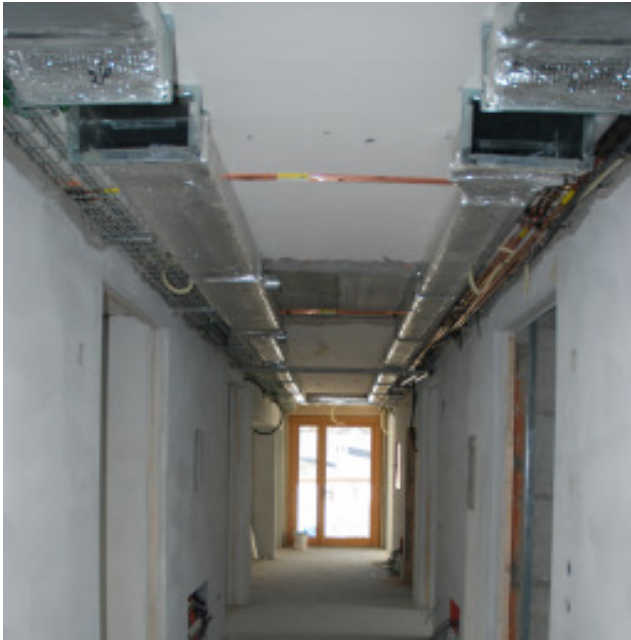
Fertigstellung der Lüftungsanlage