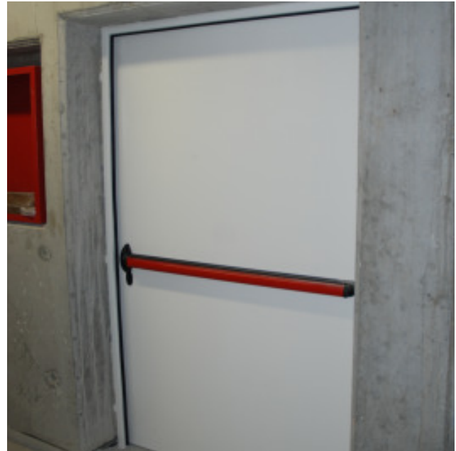
Brandschutztür bei den Magazinen