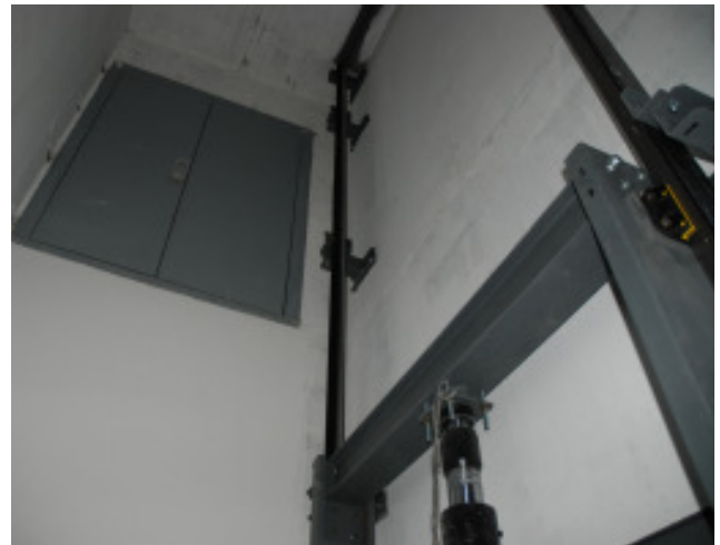
Lastenaufzug vom Unter- ins Erdgeschoss