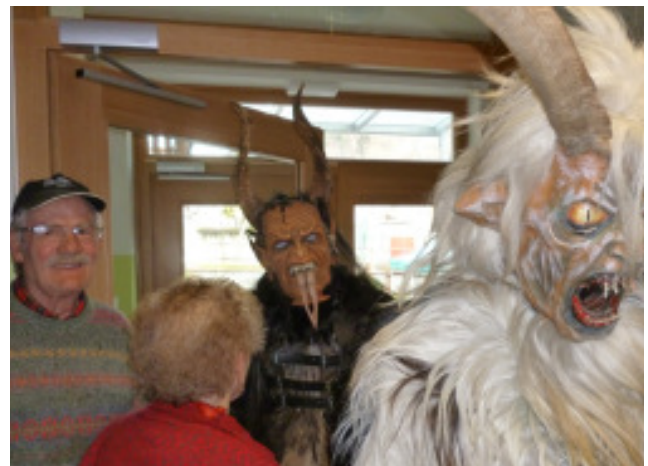
Nikolausfeier in der Außenstelle Mals